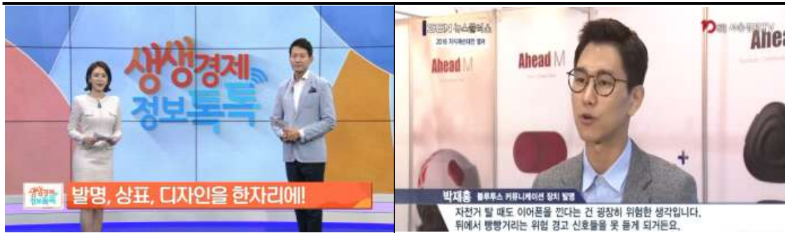
주요 매체 홍보 및 수상자 인터뷰(예시)